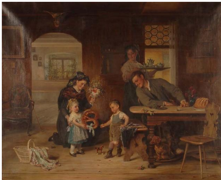
Anton Dieffenbach : Le jour de naissance (Musée de Strasbourg)

Il faut bien convenir que l'ensemble tel qu'il apparaît sur l'éventail est assez curieux : il y a une très nette disproportion entre l'enfant et les adultes, qui n'apparaît pas dans d'autres œuvres de Dieffenbach.